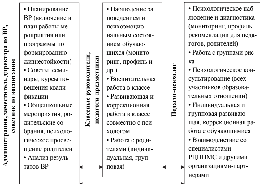
Рис. Комплексное психолого-педагогическое сопровождение детей участников СВО в образовательной организации

Исходя из этических соображений и принципа конфиденциальности психологической работы, мы можем лишь алгоритмично отобразить систему ППС и помощи каждому обучающемуся, не показывая всю глубину психологической работы. Важно осознавать, что за каждой сухой фразой алгоритма психолого-педагогической поддержки стоят реальные боль, слезы, страхи и страдания реального ребенка и его близких.